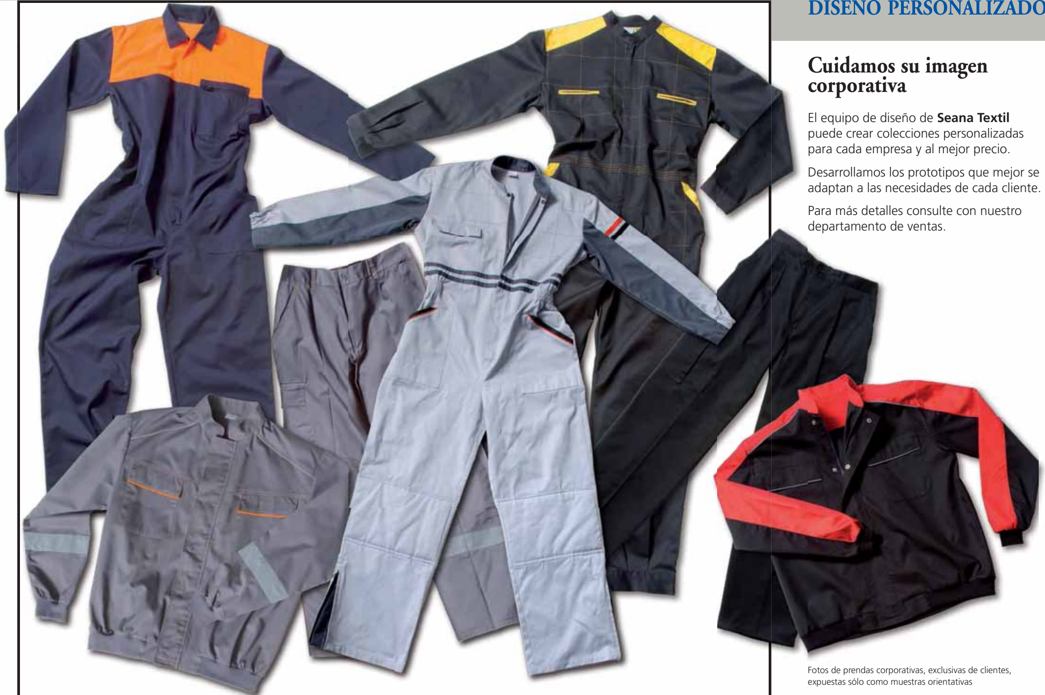
Fotos de prendas corporativas, exclusivas de clientes, expuestas sólo como muestras orientativas

Para más detalles consulte con nuestro departamento de ventas.